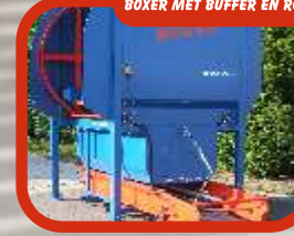
BOXER MET BUFFER EN ROLREINIGING