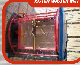
KISTEN WASSEN MET DE BOXER