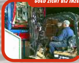
GOED ZICHT BIJ INZETTEN KIST