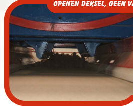
OPENEN DEKSEL, GEEN VALHOOGTE