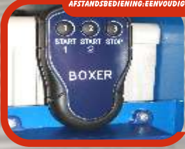
AFSTANDBEDIENING: EENVOUDIG EN ROBUUST