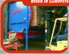
BOXER IN LIJNOPSTELLING